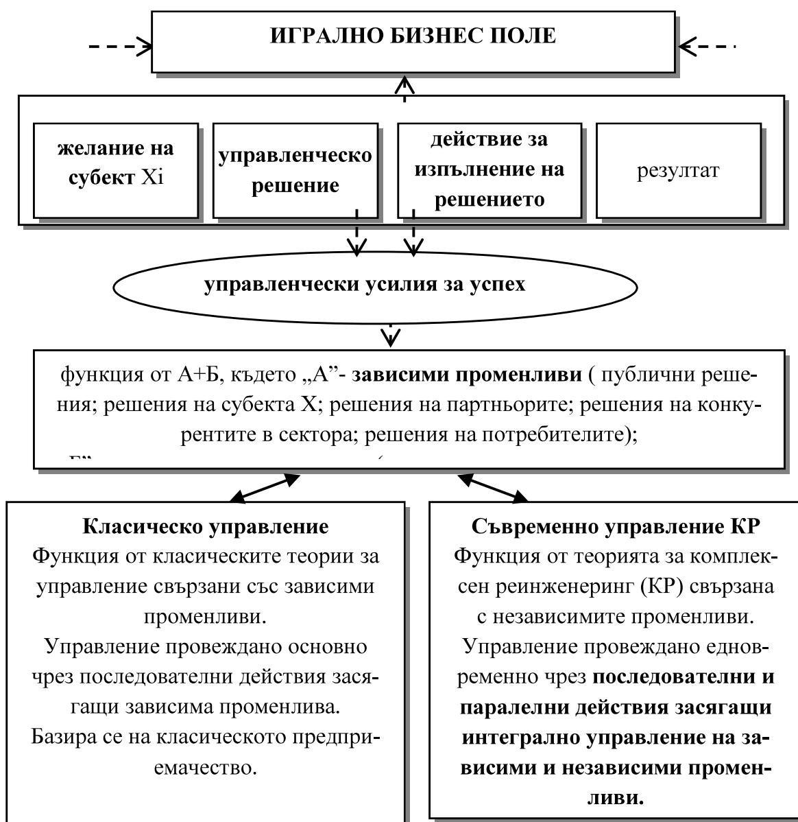
Фиг. 1. Управленчески усилия за успех в игралното бизнес поле

Общоприето за класическото предприемачество е, че всеки предприемач е мениджър, защото управлява нещо, но не всеки мениджър е предприемач, защото не всеки мениджър създава и рискува.